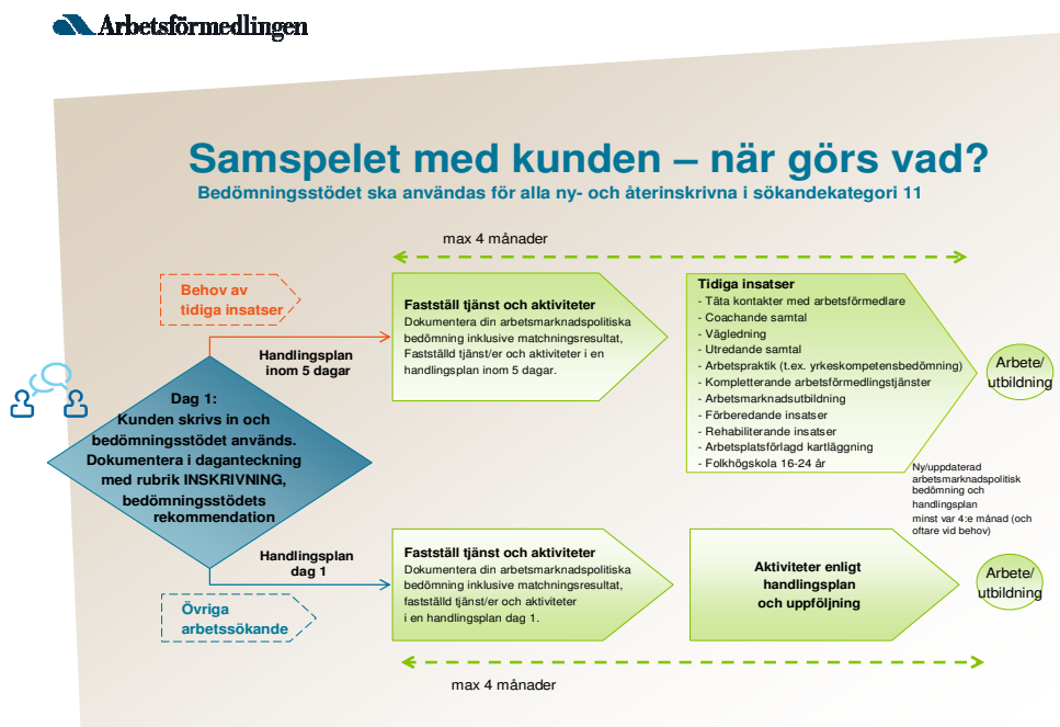
Bild 1. Den arbetssökandes process.