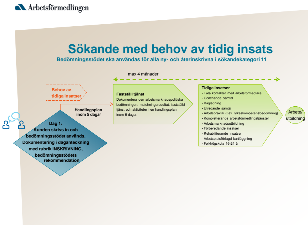
Bild 2. Sökandeprocessen för arbetssökande med behov av tidig insats.

Det är viktigt att insatserna sätts in tidigt i anslutning till inskrivning för att perioden utan arbete ska bli så kort som möjligt. De utökade täta kontakterna med alla arbets sökande ska ge ökat stöd och hjälp i processen mot arbete. Sökande med behov av tidig insats har ett högre behov av stöd från Arbetsförmedlingen för att lyckas i sitt jobbsökande. Därför har Arbetsförmedlingen beslutat att en handlingsplan med planerade insatser och dokumenterade aktiviteter ska vara upprättad inom 5 dagar från inskrivning. Nedan visas en bild av hur processen ser ut för sökande med behov av tidig insats, från inskrivning till arbete eller utbildning.